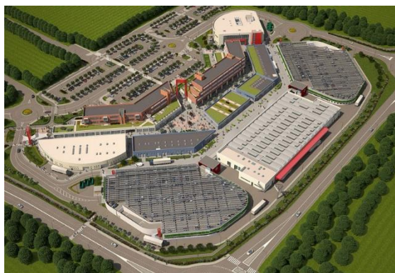
Le Piazze Lifestyle Shopping Centre Castel Maggiore (BO)