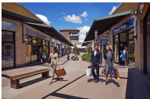
Outlet Castel Guelfo Castel Guelfo di Bologna

Commercializzazione e gestione dell'intera galleria, con rivisitazione del target brand, sostituzione di alcuni operatori e ottimizzazione dei servizi offerti (cliente: Baring Srl – Gruppo Barilla)