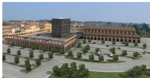
La Fornace Ravenna

Studio di fattibilità per la conversione della struttura in galleria commerciale con supermercato, realizzazione del mix merchandising e successiva commercializzazione (cliente: Consorzio Ravennate)