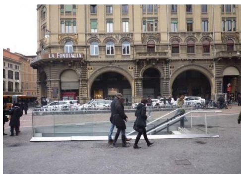
Ex Cinema Arcobaleno Bologna