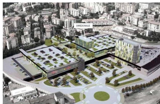
Le Officine Savona