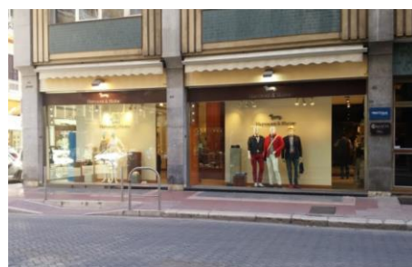
Harmont & Blaine Bari