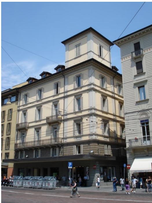
United Colors Of Benetton Bologna

Individuazione location nel centro storico di Bologna, all'interno di Galleria Cavour.