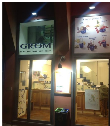
Grom Gelateria Bologna

Individuazione location nel centro storico di Ancona, in Corso Garibaldi Giuseppe. Individuazione location nel centro storico di Pesaro, in Via Branca.