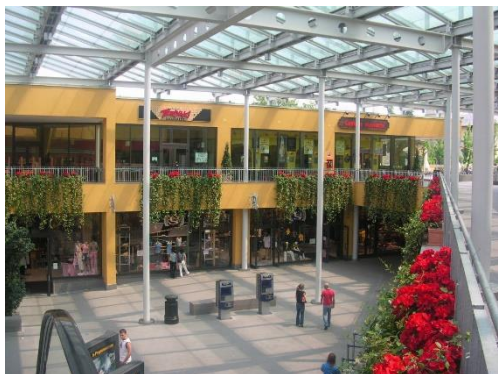
Barilla Center Parma