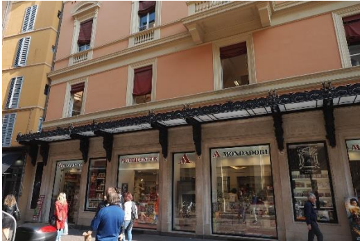
Mondadori librerie Bologna